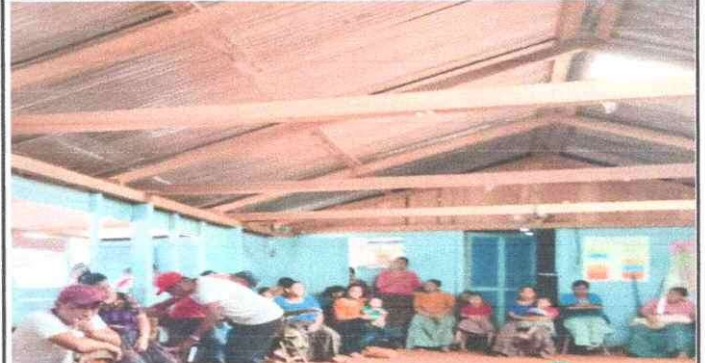
Foto 2: Sustitución de estructura de madera por estructura metálica