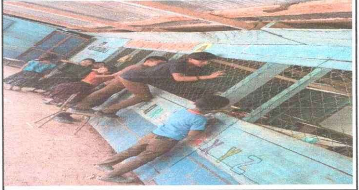
Foto 4: Sustitución de parales de madera por columnas de concreto con zapatas.