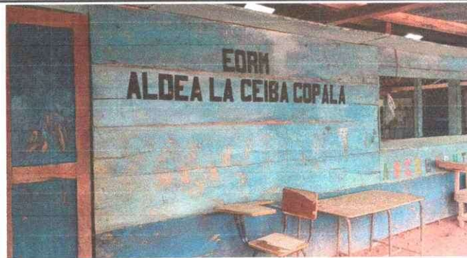
Foto 3: Sustitución de paredes de madera por pared de block, con soleras.